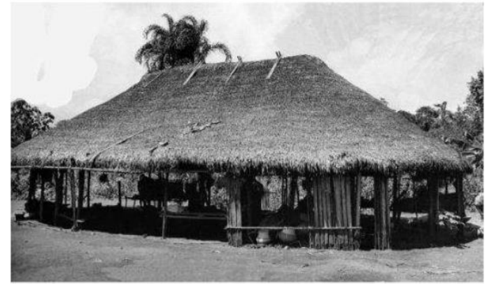
Vivienda tradicional Achuar

Los territorios comunitarios globales establecen como lote mínimo una hectárea y son independientes, exentos de impuestos y no regulados por normativas, determinantes o por fraccionamientos. En contraste, las áreas en centros poblados son parcelas pequeñas, pero con viviendas típicas de alrededor de 98 m 2 , esta superficie está relacionada a la dimensión de los "PAU", (columnas centrales de la vivienda típica Shuar y Achuar) y a la cumbre que tienen la misma dimensión.