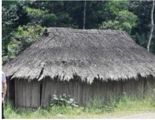
Vivienda tradicional Shuar